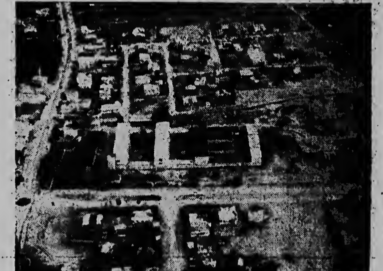
— Esaki ta e edificio (na centro) di policia y municipio di Gaza, cual formaba parte de Naciones Unidas ta usando como headquarters.